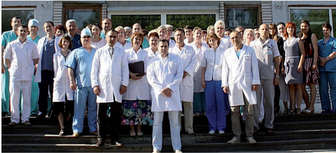
Коллектив Тульского областного онкологического диспансера.

- Я часто ставлю в один ряд профессии врача и учителя. Так вот, чтобы стать врачом или учителем, нужно прежде понять, что это твое призвание. Если учитель или врач не любят свою работу и не любят своих подопечных, они в этих профессиях не приживутся. И конечно, чтобы стать врачом, нужно много и добросовестно учиться – сначала в вузе, потом в ординатуре, потом нужно пройти первичную специализацию. В общей сложности на подготовку врача уходит около девяти лет.