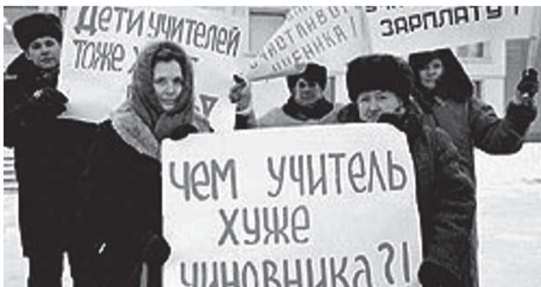
Пикет голодающих учителей в 1990-е годы.