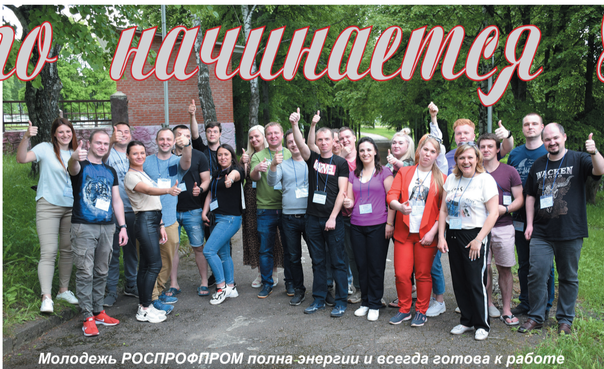
Молодежь РОСПРОФПРОМ полна энергии и всегда готова к работе

В связи с праздниками позвольте пожелать тульским оружейникам и машиностроителям успехов в работе, доброго расположения духа, здоровья и благополучия.